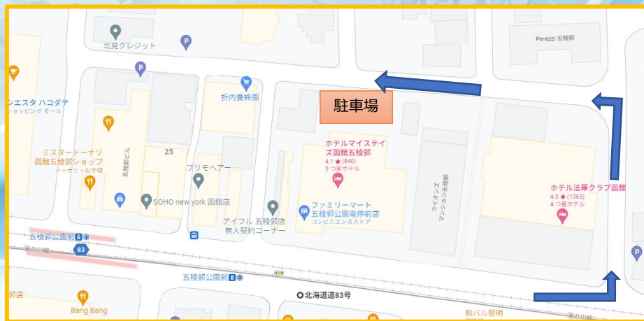
ホテル マイステイズ函館五稜郭

駐車場はホテルの裏口側（市電の反対側） にあります。 自家用車でお越しの方は受付にて お申し出ください。